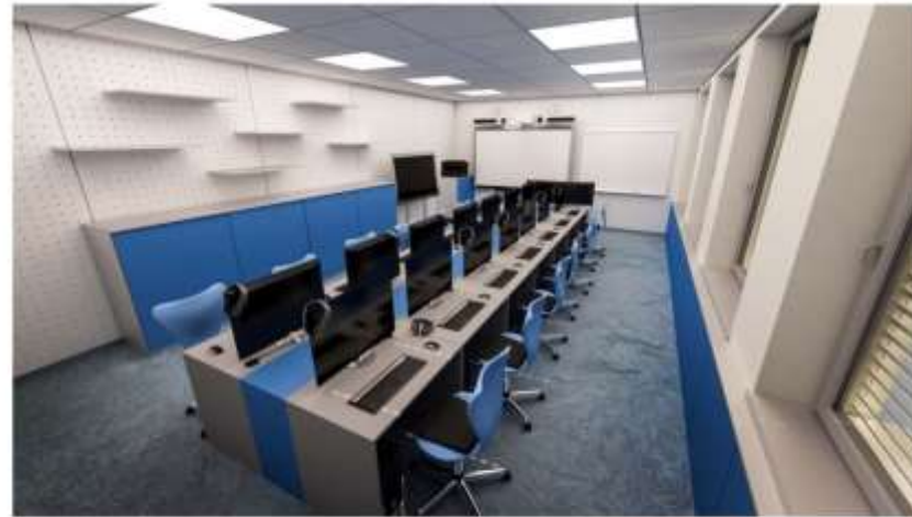
Vizualizace Centrum interaktivní výuky Stacionární digitální učebna - pohled A