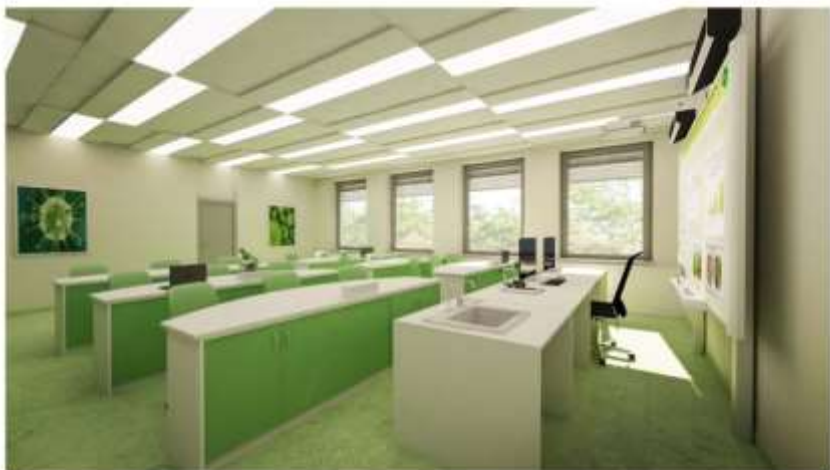
Vizualizace Centrum interaktivní výuky Mobilní digitální učebna - pohled B