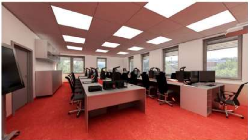
Vizualizace Centrum interaktivní výuky Odborná 3D učebna - pohled A